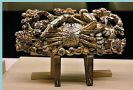
▲金漆通雕梅花螃蟹樑托 ►金漆鏤通雕蟹簍