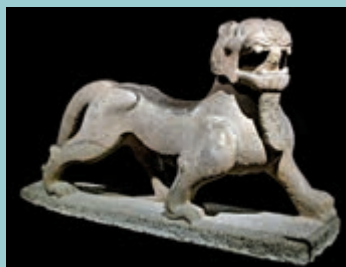
▲石天祿，西安碑林博物館藏品

3 「一統天下：秦始皇帝的永恆國度」：展出約120件（組）由陝西省文博單位借出的文物，難得一見的秦代金玉器等重点展品。