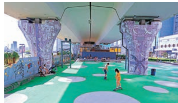
▲疫情下，同學們也想到外面去呼吸一下新鮮空氣，輕鬆一下

夜幕降臨，我們八個同學走在回家的路上。我心中對自己說：明天要好好溫書了，把今天的時間補回來。還有，最希望這場可惡的疫情快快過去吧！