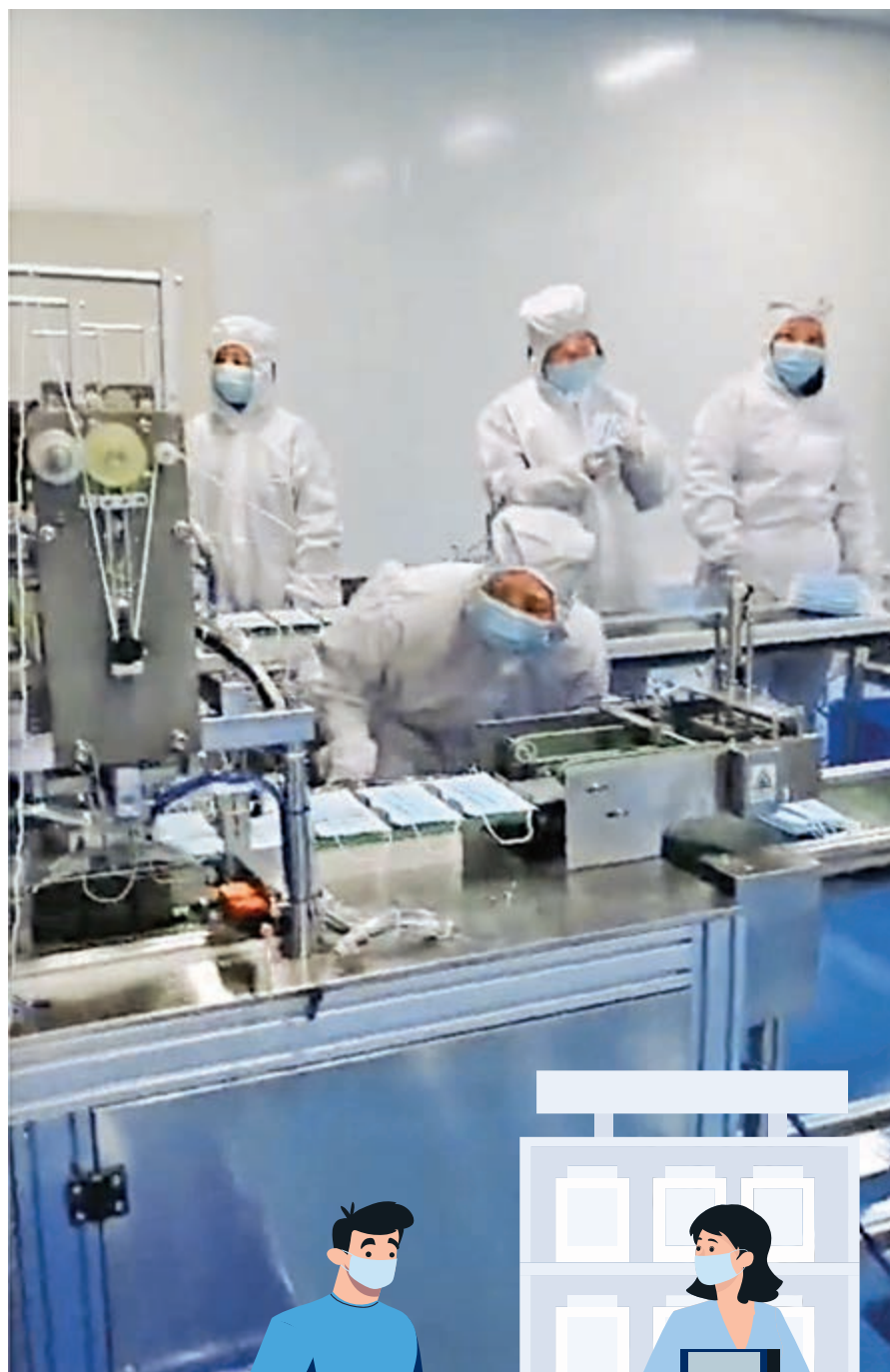
◀高博在陝西開設口罩廠，內設兩條N95口罩生產線及六條醫用外科口罩生產線