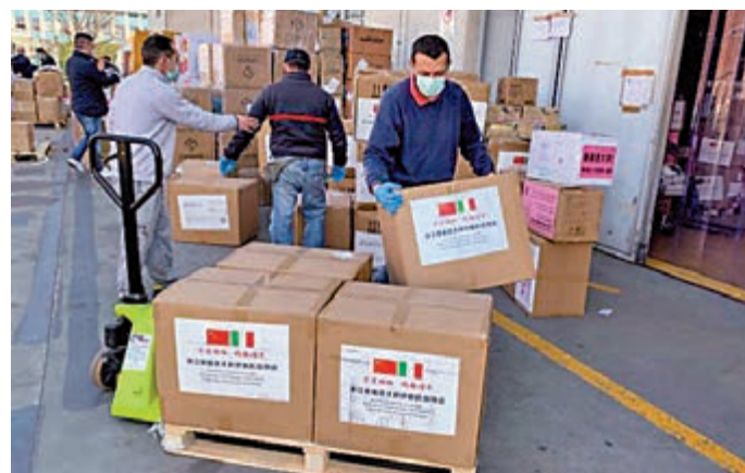
▲中國的防疫物資運抵意大利

會提供，有的是來自企業、行業協會，另有部分是海外客戶的直接訂單。一些歐洲國家的地方政府和醫療體系透過我國駐當地領事館和商會集中採購。而出口給歐洲的防疫物資貨源需要進行嚴格篩選，內地廠商很多，但其資質要符合國家標準和歐美標準，總體還可以，大多數產品能夠達到歐美的質量要求。