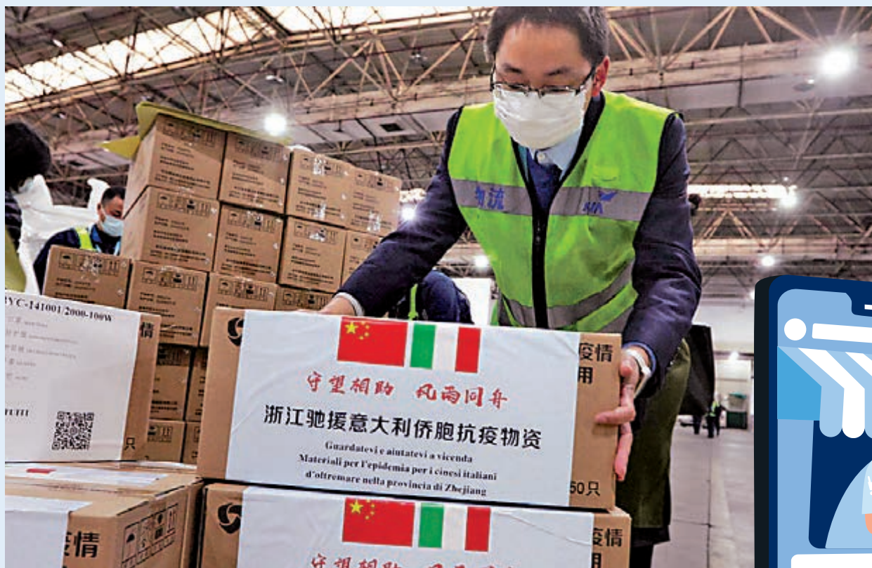
▲內地積極支援外國抗擊疫情

今年春節期間，湖北武漢爆發新冠肺炎疫情後，許多香港跨境電商紛紛行動起來，他們從國外進口大量防疫物資，支持香港和內地抗擊疫情，時常要夜以繼日地工作，體現了他們的愛國情懷。隨着內地疫情的好轉，現在他們又積極支援外國抗擊疫情，紛紛將口罩、防護服、額溫槍和洗手液等出口歐美等國，展現了他們積極的國際人道主義精神。