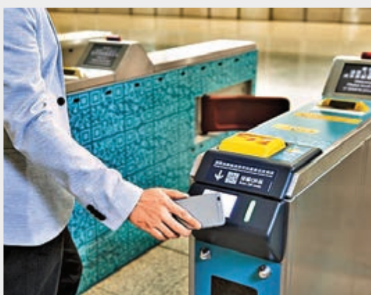
▲港鐵將於年底前推出用支付寶二維碼入閘

港鐵也同時推出「MTR分」獎賞計劃，整合港鐵現有兩個獎勵計劃，透過搭乘港鐵，在四個指定港鐵商場及港鐵車站的參與商戶消費滿指定金額，或購買港鐵精品均可累積獎分，便可兌換獎賞。