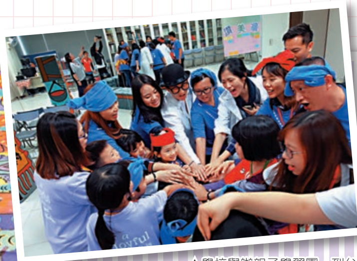
▲學校舉辦親子學習團，到台灣取經，推行生命教育

「社會一直有意無意吹捧『成功教育』，過去我們以為學生只要操行好、成績好、入到一間好學校，學到一體一藝，就叫達到成功指標。但是現實完全不是這一回事，每年踏入九月、十月，不時聽到學童自殺的消息，出事的學生很多都是本來看似沒事，但最後卻選擇輕生，從中看到『成功教育』有缺憾。」蔡校長說，每個學生的學習能力不一，各有快慢，學校亦不只是知識工廠，面對職場工種隨時代不停演變，單單追求術科成績已經不能滿足學生需要，應培養他們具有足夠抗逆力，好面對各種難關和挑戰。