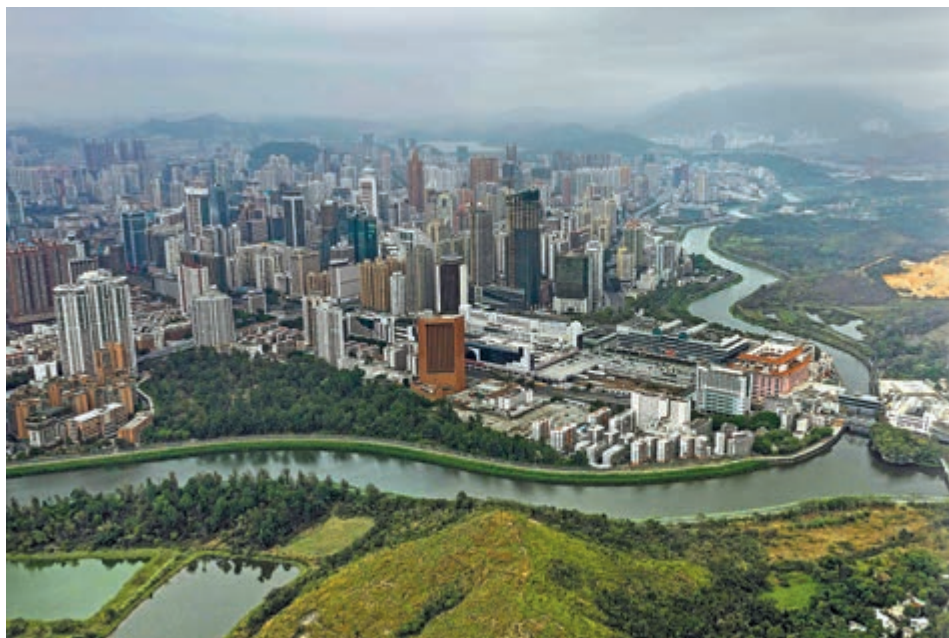
▲連接深圳和香港的深圳河鳥瞰圖

作為中國經濟的重要增長極，粵港澳大灣區建設帶來許多機遇，在推進的過程面對不少挑戰。與世界其他三灣區最大的不同，粵港澳大灣區涉及到「一國