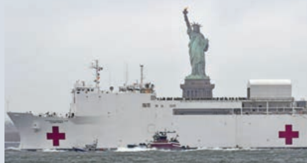
◀「安慰號」醫療船經過紐約艾麗絲島時的情景

由於實際效用不佳，「安慰號」在4月30日離開紐約，「仁慈號」在5月15日離開了洛杉磯港。