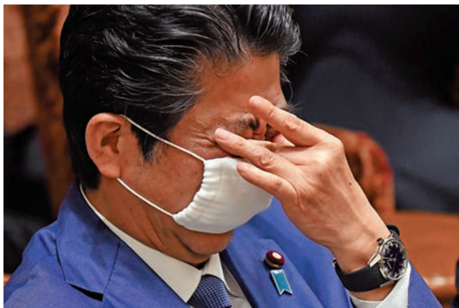
▲日本首相安倍晉三