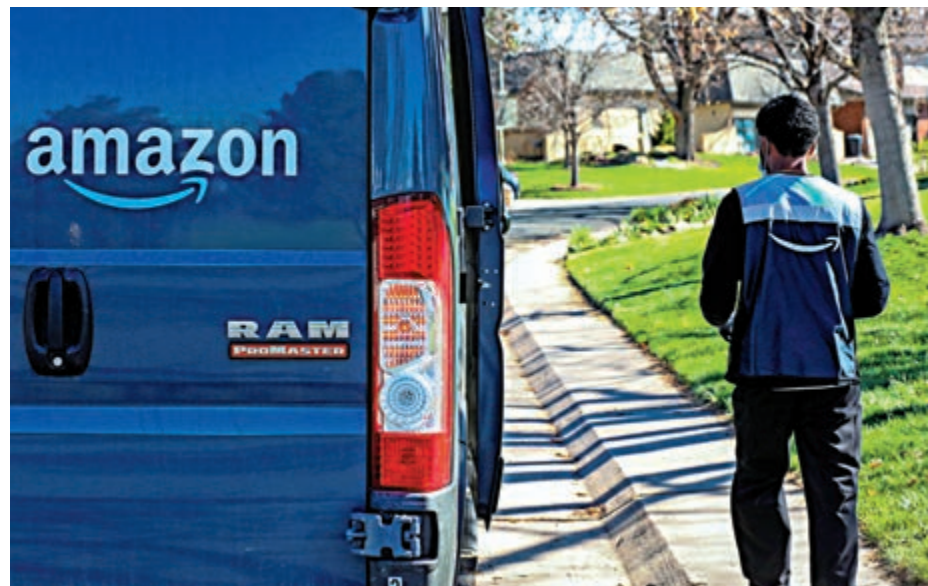
▲亞馬遜的速遞員4月份在科羅拉多州派送包裹