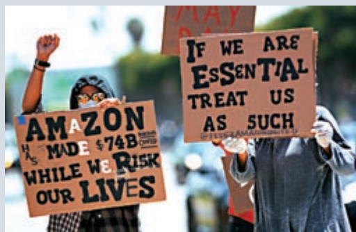
▲5月1日, 亞馬遜的員工在加州示威, 抗議公司提供的抗疫裝備不足