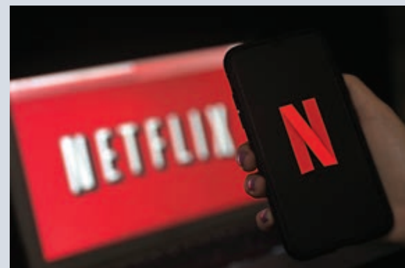
▲串流音樂平台Netflix在疫情期間業績不俗

不過，新冠肺炎疫情持續，影視製作也要暫停，Netflix等公司能否有足夠新片推出以支持串流平台擴張，也是一個挑戰。