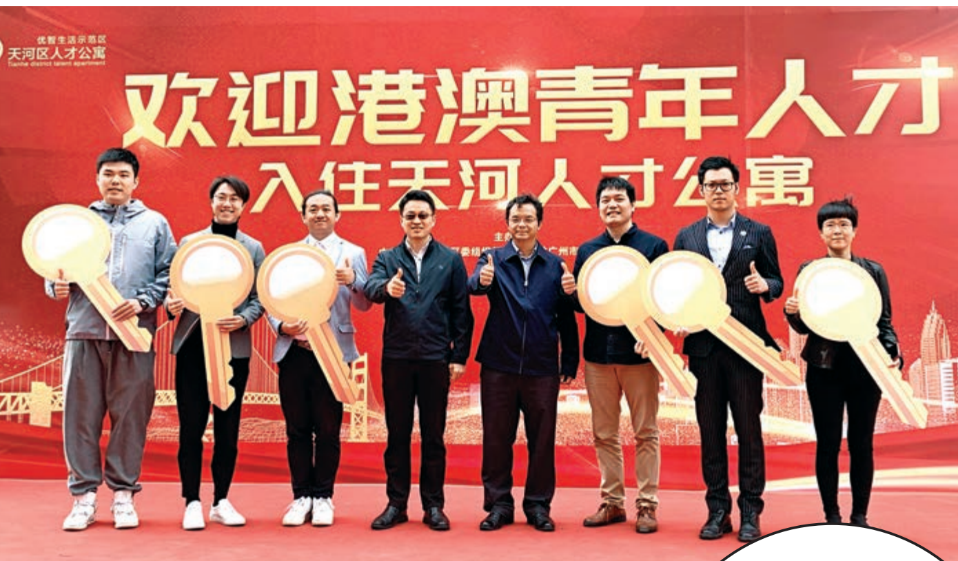
港澳青年人才獲得鑰匙入住天河區人才公寓