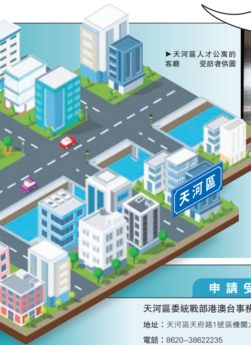
▶ 天河區人才公寓的客廳 受訪者供圖

有志青年來穗創業，首先需要解決居住問題。為此，廣州天河區和黃埔區為來大灣區人才服務規劃建設了港澳青年人才公寓，為來穗發展的港澳青年提供便利。公寓配套設施齊全，周圍生活服務配套完善，港澳青年可實現「拎包入住」。