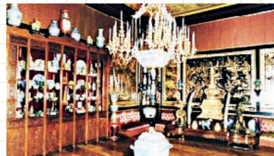
◀楓丹白露博物館之中國館

英軍也將所劫走的一部分圓明園文物獻給了當時的維多利亞女王，並收進了大英博物館的東方藝術館，其中最知名的是東晉時期大畫家顧愷之的《女史箴圖》的唐代摹本，乃我國古代卷軸畫中的稀世珍品。