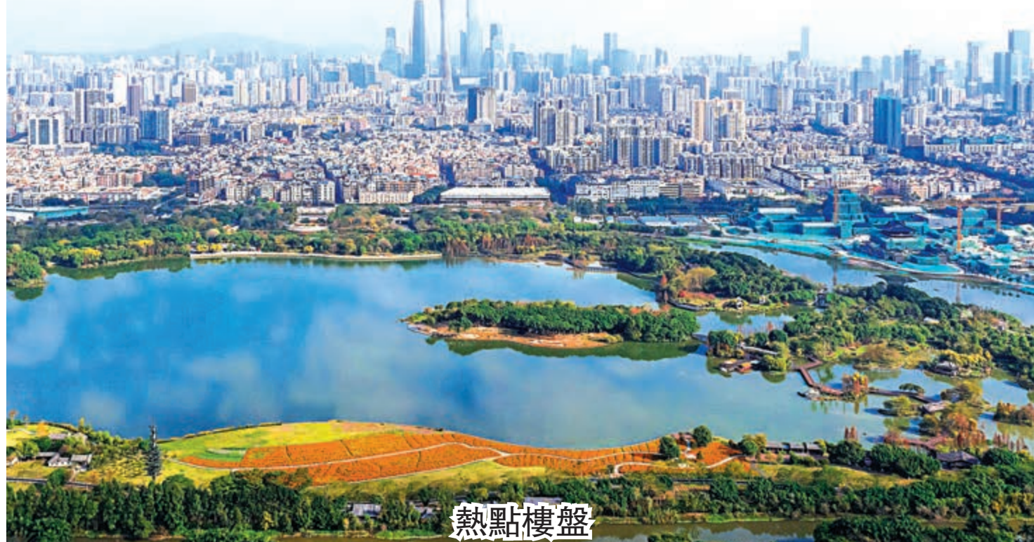
▼環境優美的海珠湖

位於海珠區中部，總用地面積5.24公頃。擬調整內容為根據現行更新政策對地塊進行改造，由政府收儲後進行開發建設。從現行控規示意圖看，地塊目前用地性質為商業金融用地。地塊周圍也是海珠區主要的居住社區集中地，商品住宅的二手掛牌價格主要在4萬至5萬之間