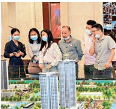
▲民眾在白雲區樓盤看房