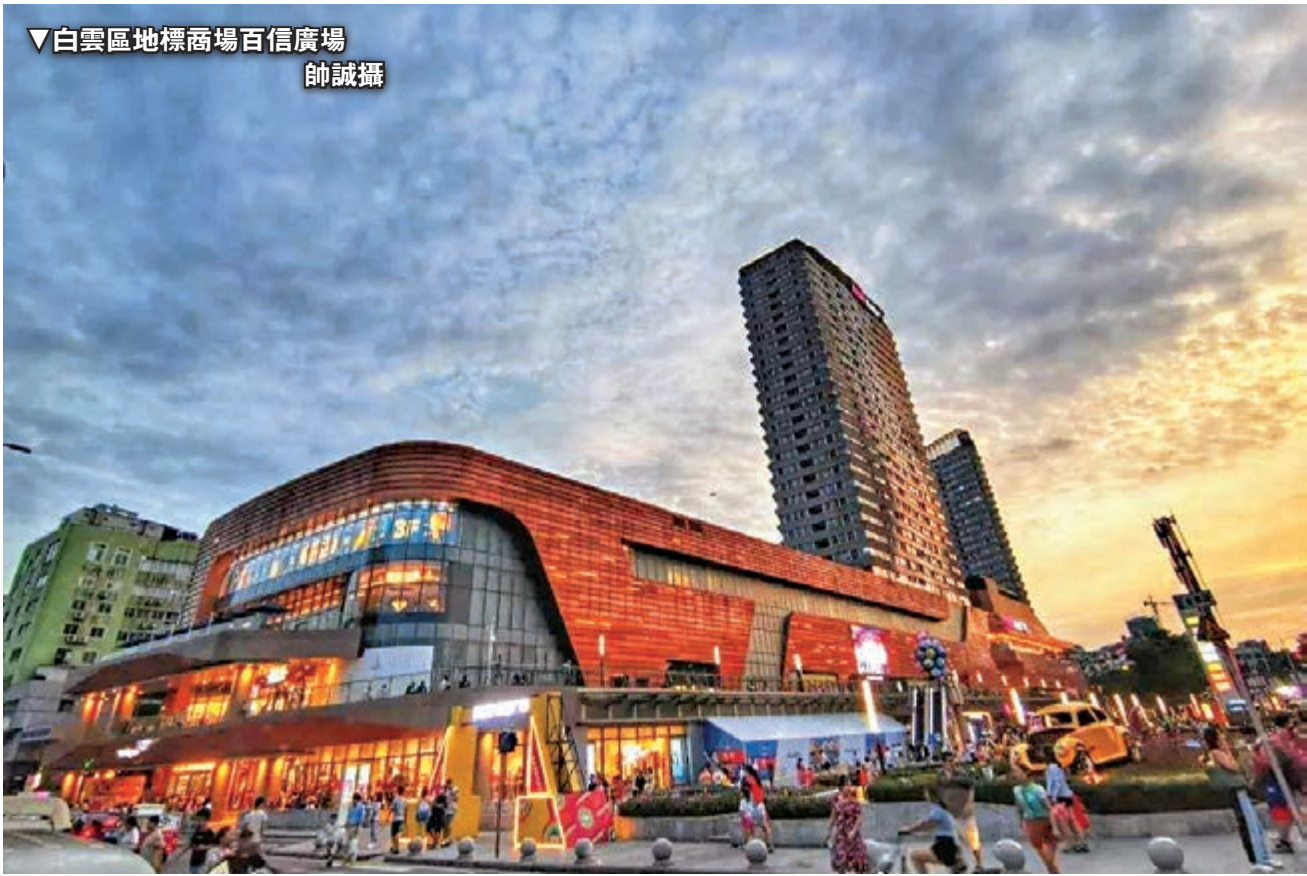
▼白雲區地標商場百信廣場