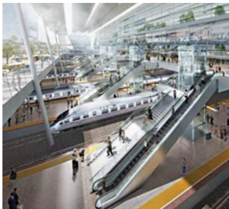
▲白雲區白雲站規劃圖