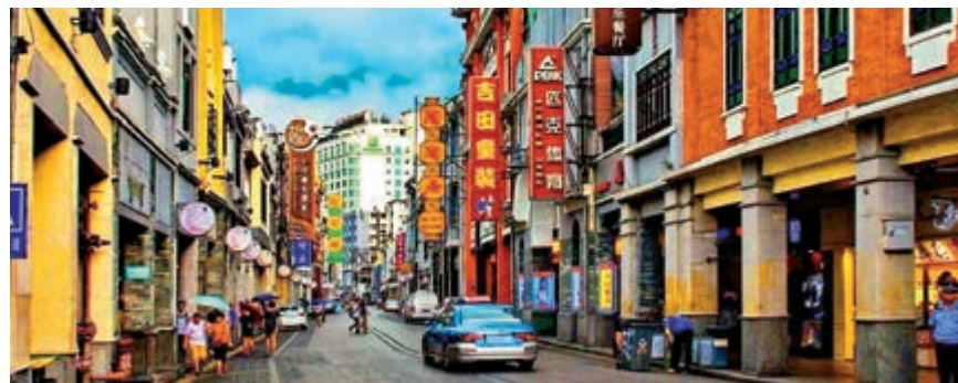
◀嶺南建築重要標誌「騎樓街」

今年荔灣提出以構建「粵港澳大灣區新商貿價值中心」為目標，構建「一帶兩區」發展新格局，打造「灣區門戶、廣州名片、產業高地、現代商都」，加快建設具有獨特魅力和發展活力的國際大都市現代化中心城區。