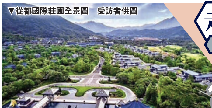
▼從都國際莊園全景圖

「宜居環境、便捷交通，以及房價是港人內地置業的三大關鍵因素。」廣東房產頻道特約評論員黃韜說。一直以來，從化高性價比的樓價優勢使其成為廣州最後的價值窪地，同為不限購的增城區樓盤均價已突破每平方米2萬元（人民幣，下同），但從化區均價目前仍維持1.6萬元以下。不少人認為，在從化區置業，已成為港人退休養老，寄情山水的首選。