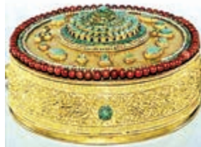
◀藏傳佛教寺廟擺設金曼扎