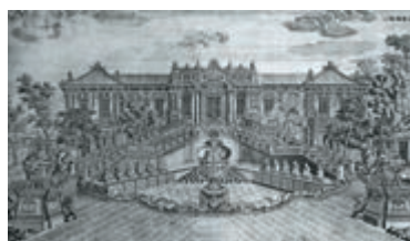
▲圓明園海晏堂十二生肖噴泉圖