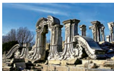
▲北京圓明園遺址公園內的大水遺址

次殖民地一詞，是孫中山先生於1924年在廣州演講三民主義時提出的。他認爲次殖民地雖然擁有主權，卻承受着列強在政治、經濟，以及人口三種壓迫，喪失獨立自主的權利，境遇比殖民地還要差。他指出，表面上中國雖擁有行政機關和軍隊，但是在經濟、軍事及外交等方面，都是由列強操控，他們完全沒有在中國建設，卻就坐享其成。因此，當時中國的處境是連殖民的地位都不如，所以應該叫次殖民地。