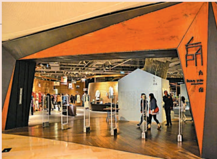
▲方所首家書店開設在廣州

方所書店曾獲2015年日本Good Design Award設計大獎、美國Best of Year Awards設計大獎、德國iF Design Awards設計大獎等，並被美國《AD》雜誌評為全球最美15家書店之一。有世界各地超過50000種、逾90000冊出版物，當中包括不少台版書、港版書、英文書及獨立雜誌，不少是已絕版的書籍。咖啡區的設計是中式與日式的簡潔風格。