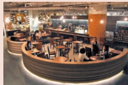
◀每間方所都設有咖啡區