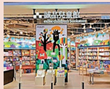
▲誠品荃灣愉景新城分店