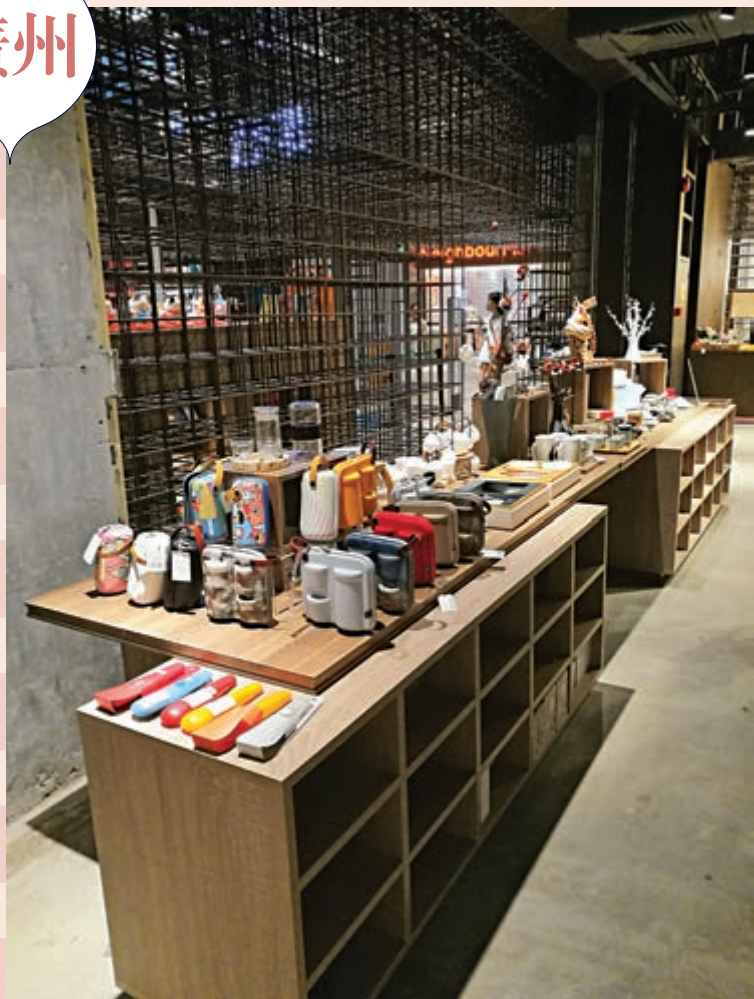
▲店內文創館展示文創產品