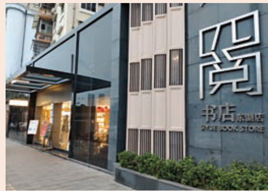
▲四閱書店整體採用新中式設計風格

四閱書店在整體上採用新中式設計風格，延承廣州陳家祠的建築設計風格，1500平方米的書店以中庭的圖書展示與文化活動區為中心，四周圍繞着文房四寶、咖啡廳、鮮花屋、文創區、圖書館、開放閱讀區等區域，形成縱橫規整又突出主題的書店格局；主體色調以暖黃燈光為主，搭配原木書架、桌椅，穩重大氣又不失溫馨舒適之感。