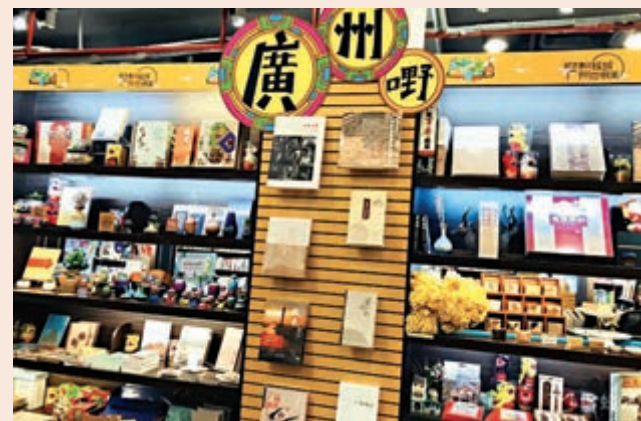
▲書店推出自主文創品牌「廣州嘢」

如果覺得逛書店有點悶，還可以給自己買束花，或是到文創區玩活字印刷，看看創意茶具。