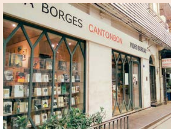
▼廣州的民營書店中，成立於1990年代的博爾赫斯書店算得上歷史悠久