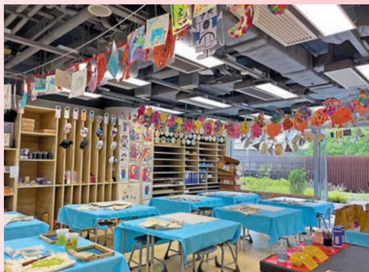
◀香港威雅學校注重學生全面發展，美術室內外掛滿學生畫作。