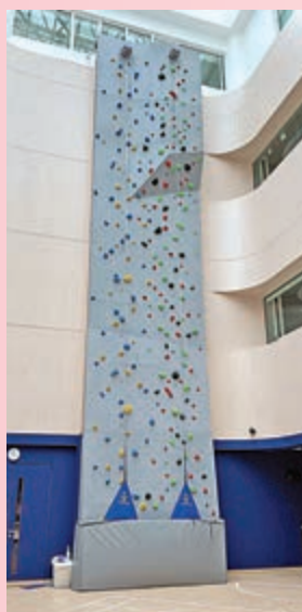
▲學校體育館內設有14.5米高的室內攀岩牆。