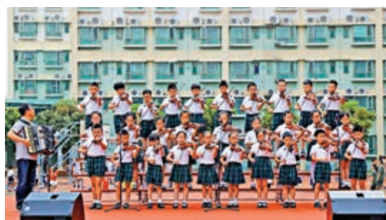
◀ 北大附中深圳南山分校舉行學生藝術表演。

學校為「廣東省一級學校」、「廣東省首屆十佳民辦學校」，在校學生4000餘人，全部實行小班教學。在已經畢業的學生當中，有六十多人以優異成績先後考入英國劍橋大學、美國杜蘭大學、加拿大多倫多大學、澳洲悉尼大學、日本早稻田大學等國外知名學府深造，有二百多人考入國內北大、清華、中國人大、香港大學等重點大學學習。