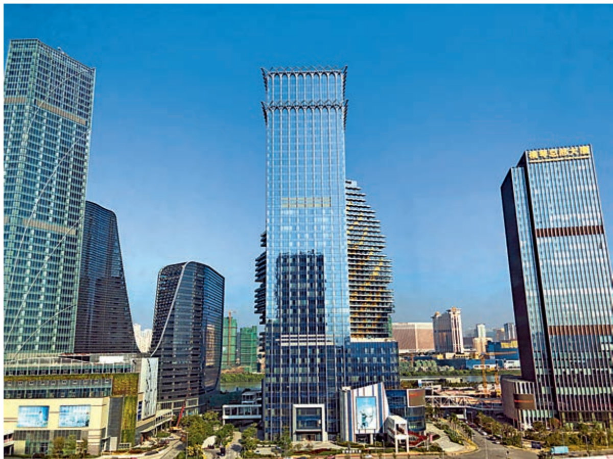
▲橫琴近年發展迅速，吸引港澳客前來置業。