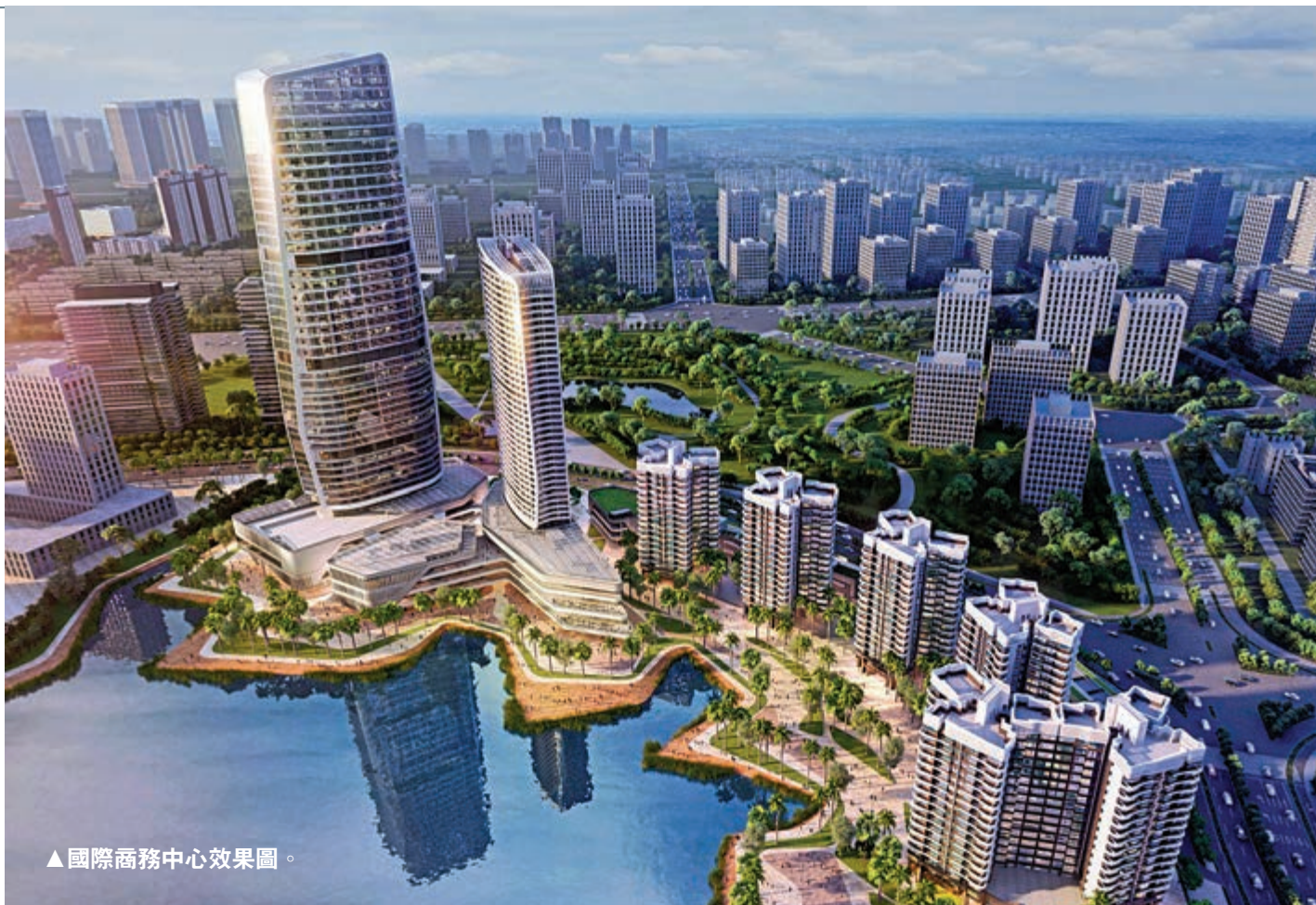
▲國際商務中心效果圖。

「『鄰里中心』已成為航空新城公共配套的一大特色。」金灣區住房和城鄉建設局有關負責人表示，