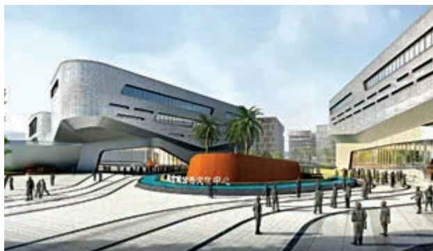
▲公共文化中心效果圖。

新冠疫情以來，地處珠海西部的金灣區「航空新城」和西部中心城區樓市穩中上升，不輸於橫琴自貿區。據珠海房地產業界數據顯示，目前「航空新城」的一手樓資源，每平米最低2.7萬元（人民幣，下同）左右，同比增約35%，最高達3.5萬元，45到140平米的戶型皆可選擇；二手樓價均價約在1.8萬到2萬元，個別品質樓盤可去到2.4萬元。據幸福家房產網有關負責人稱，「航空新城」作為珠海產業西進、城市西拓的主陣地，其規劃十分高端，「該區域樓市前景看好」。