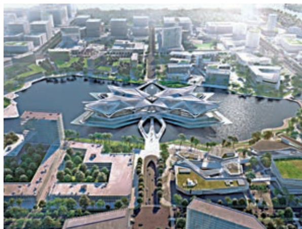
◀市民藝術中心效果圖。

同時，航空新城核心區內還引進了毛林惠豐酒店、加華總部、華發西部商都、邁科智能、華發創業大廈、湖城大境、築巢科技等7個現代服務業項目；航空新城中學、航空新城第二小學、航空新城第二幼兒園和建築面積超過3萬平米的片區鄰里中心均在施工之中，兒童友好型社區的建設也在逐年升溫，形成宜居宜業宜遊的優質生活圈。