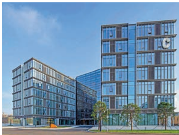
▶「航空新城」產業服務中心效果圖。