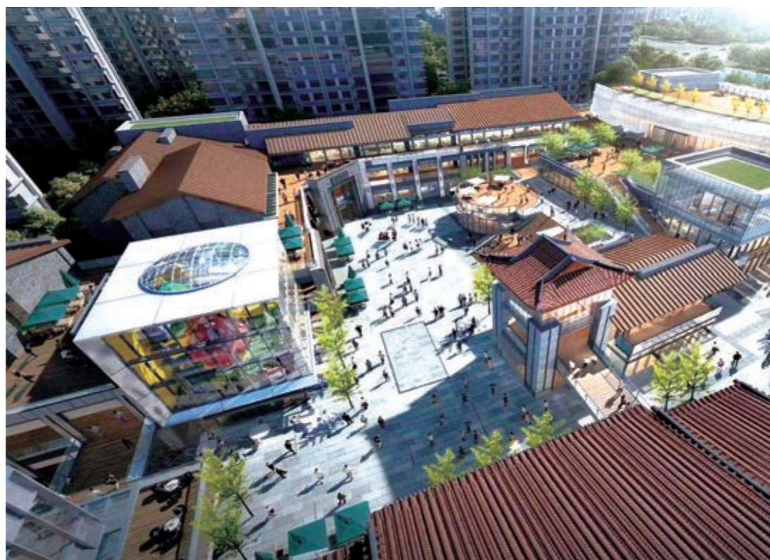
▲星愉灣依公園而建，內外景觀隨心相伴。圖為星愉灣效果圖。

湖心路片區的教育資源也在持續發力，學位緊張程度逐步緩解。周邊規劃有6所幼兒園、4所小學、2所中學，教育資源密集。區內多個樓盤都配建教育資源。其中中鐵建湖心公館將配建1所18班幼兒園；恒大濱江左岸花園將配建1所30班小學；湖心金茂悅將配建1所12班幼兒園，1所24班小學，1所30班初中。