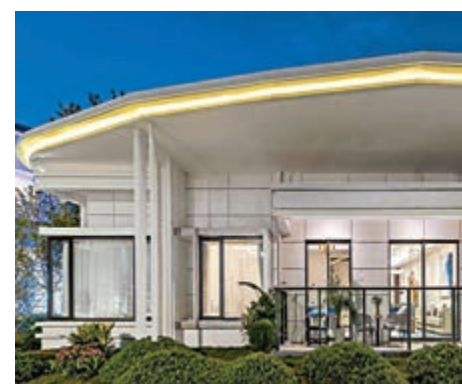
▲復地星愉灣社區實景。