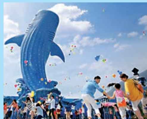
▲橫琴新區擁有長隆海洋王國等綜合娛樂項目，對於有年幼孩童的家庭具吸引力。

最新數據指出，截至今年8月底，橫琴實有澳資企業超4500家，註冊資本超1300億元，成為內地澳資企業聚集最集中的區域。澳門居民在橫琴購買物業也超1.1萬套。