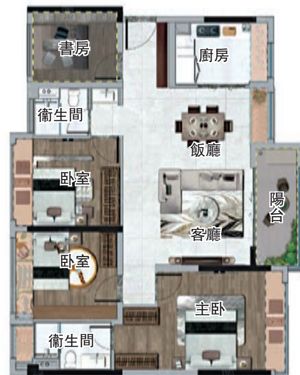
▲奧園學苑壹號125平米3房2廳戶型圖。

1公里範圍內有公立小學翠微小學，香山幼兒園等2所公立幼兒園，珠海仁愛醫院。位於主城「內環線」中心段，通過金琴快線可速達珠海南北兩地，未來借助深中通道（在建）、深珠通道（規劃），更可實現「灣區車程一小時生活圈」