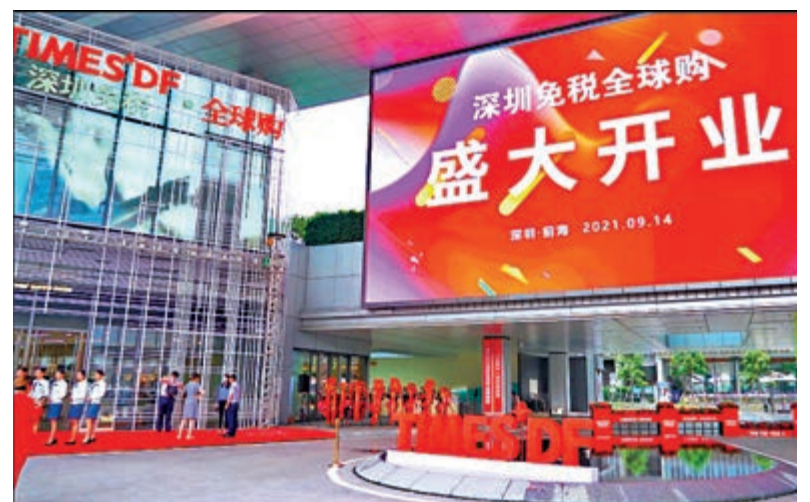
▲深港商貿物流小鎮的深免全球購體驗店開業。