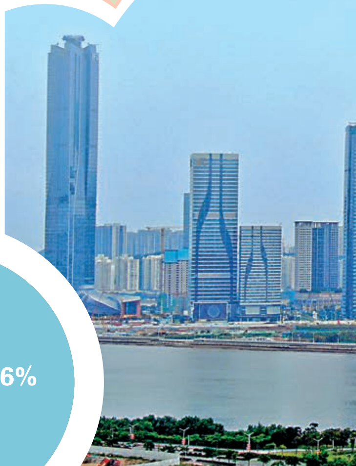
►橫琴島瞰圖（無人機拍攝）。