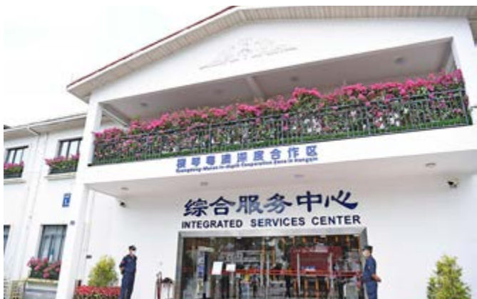
◀橫琴粵澳深度合作區綜合服務中心。