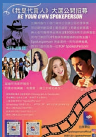
▲「SpokesPerson」平台早前在香港海選招募網紅。