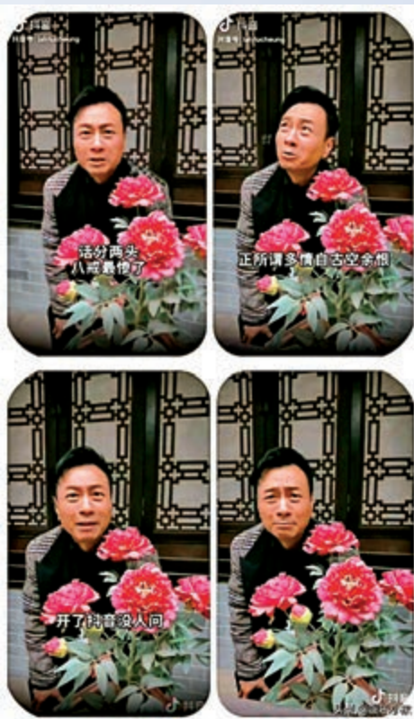
▲黎耀祥今年初開設抖音賬號，「初來報到」的他重演經典角色，為賬戶絞盡腦汁「吸粉」。