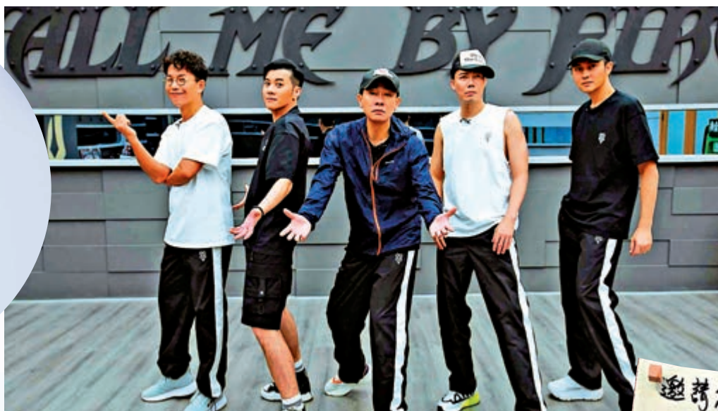
▲《披荊斬棘的哥哥》裏的「大灣區哥哥」深受觀眾喜愛。

數月前內地已傳湖南衛視網絡影片平台「芒果TV」與無綫電視（TVB）合作舉行「超S級港樂歌唱競演節目」，透露此節目將由《我是歌手》製作團隊原班人馬製作，「用全新表達 重塑港樂經典金曲」，包含粵語金曲、港產國語、港風融合、煥新填詞等。10月20日TVB正式宣布，與芒果TV合作的《聲生不息》正式招生。今次報名日期非常短，至10月24日截止。招募海報亦列明，目的是希望可以尋找熱愛廣東歌、具演唱能力、音樂創造力及舞台魅力之歌手。