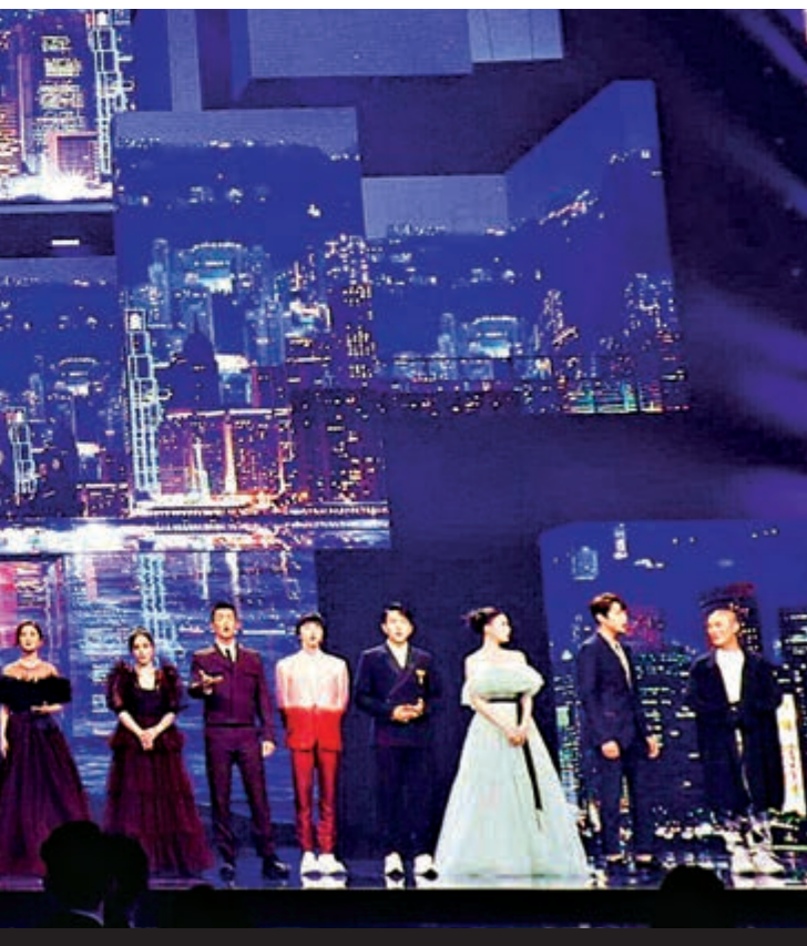
◀「灣區升明月」二〇二一 大灣區中秋電影音樂晚會深圳會場。