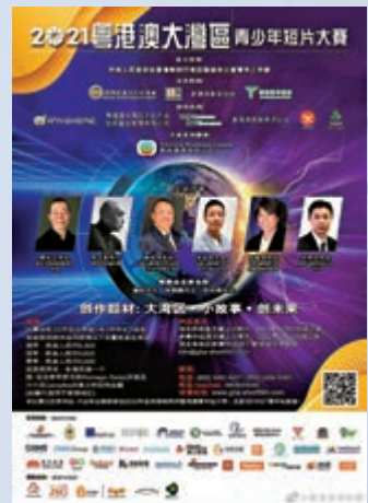
▲「2021粵港澳大灣區青少年短片大賽」即日起至12月31日接受報名。

由國際創意及科技總會、沙龍文化產業研究所、新媒體影音協會及香港青年聯會聯合主辦，以「大灣區·小故事·創未來」為主題的「2021粵港澳大灣區青少年短片大賽」，由即日起至今年12月31日接受報名。TVB總經理（節目內容營運）曾志偉擔任該比賽專業評審之一，早前他出席記者會，分享拍攝短片的要點及注意事項：「故事主題很重要，要講返大灣區（主題），以及短片不要太長，最好是在10至15分鐘內」，亦希望透過活動培養更多對電視行業有興趣的年輕人。