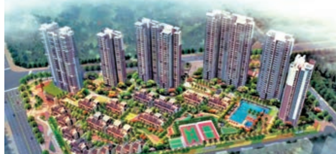
圖 ▶ 天琴灣花園效果圖。