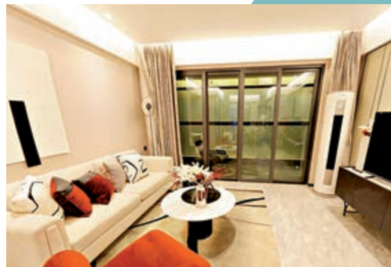
▲莞佳·雲麓半山示範單位客廳布置。

莞佳·雲麓半山周邊的教育配套資源豐富，距項目約250米爲市一級塘廈初級中學、約500米爲金桂園學校，5公里內17所學校環繞，解決20年教育問題。這個樓盤一路之隔即天麓山風情商業街，5公里內4大商圈環繞，醫院、教育、產業一應俱全，比較方便。