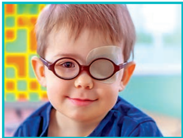
▲ 兒童斜視可以透過「遮蓋眼睛」訓練進行治療。