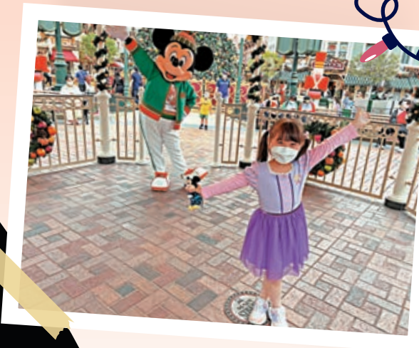
◀ 小朋友換上聖誕裝束與米奇影相。