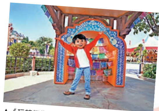
▲ 《玩轉極樂園》的主角米哥首次現身香港迪士尼樂園。