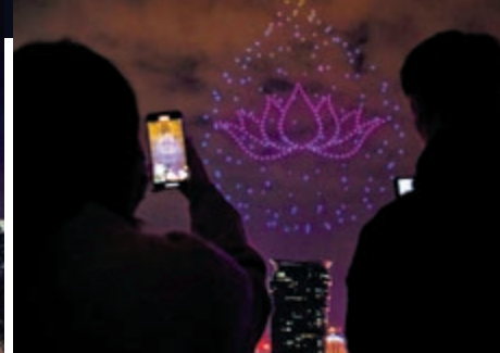
▲無人機表演結合科技、燈光、音樂等元素。