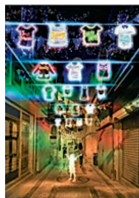
▲主辦方藉光與影為觀眾帶來歡樂與正能量。