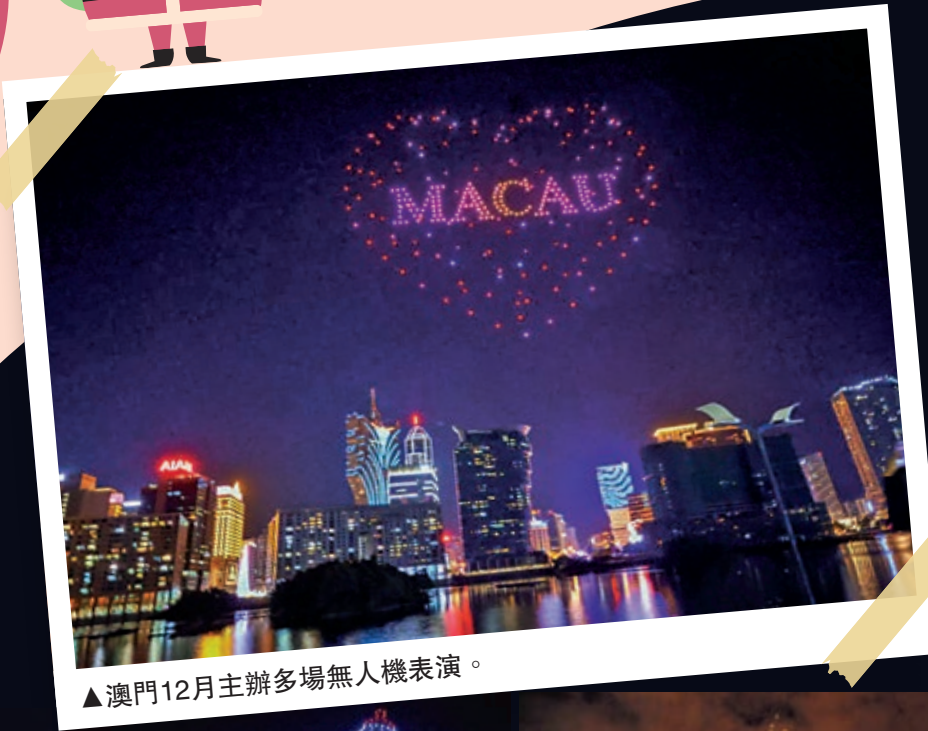
▲澳門12月主辦多場無人機表演。

聖誕夜（12月25日），來自北京的專業隊將以「澳遊聖誕」為主題，並以澳門建築物、體育特色和聖誕元素為主。由一張寄出的明信片開始，引出澳門地標建築及旅遊文化，同時將澳門格蘭披治大賽車這一個具有澳門特點的體育運動，也放到無人機表演中呈現，亦加入聖誕元素，以配合節日氣氛。