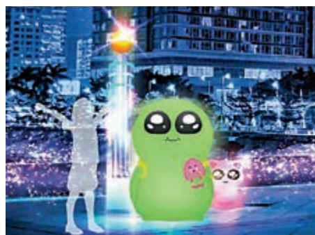
▲澳門光影節以「火星想旅行」為主題。