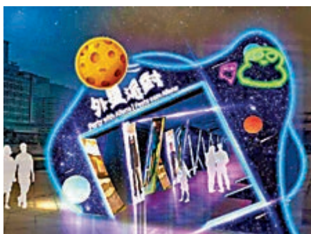
▲外星人到澳門開派對。