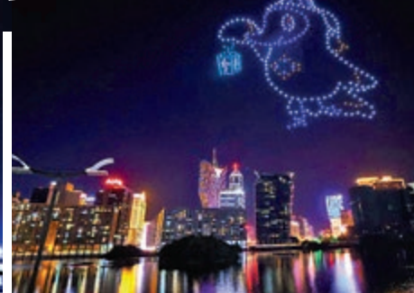
▲無人機表演燃亮澳門夜空。