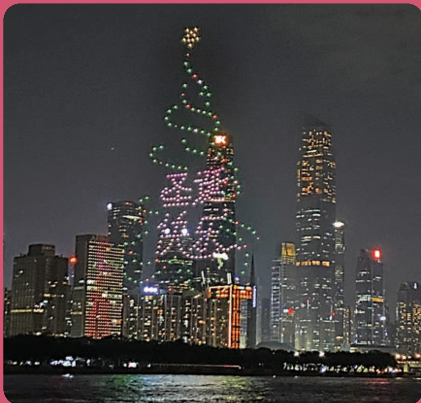
▲ 「珠江夜遊」是遊廣州的經典項目，遊客在聖誕前乘船夜遊，偶遇無人機於珠江上空表演「聖誕快樂」。