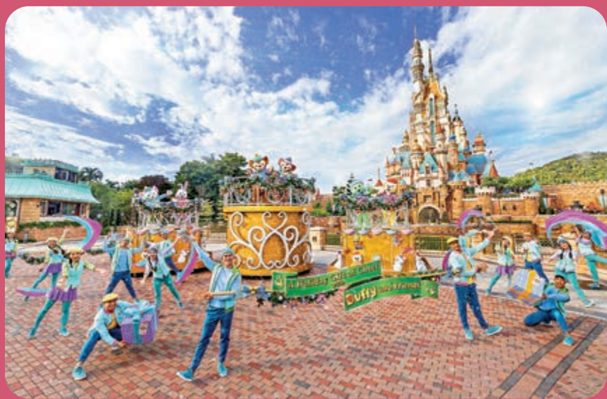
▲ 今個聖誕，香港迪士尼樂園有不少聖誕主題表演。