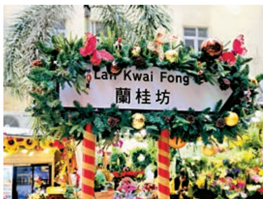
◀ 每逢聖誕節、除夕夜，蘭桂坊都是香港最熱鬧的地點之一。