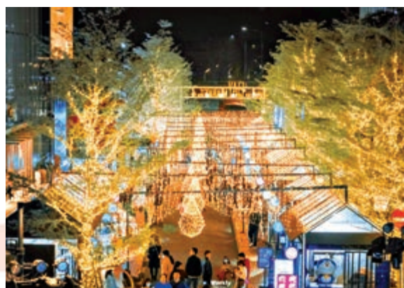
◀ 深圳灣萬象城的市集，以優雅的燈飾布置成聖誕樹，燦爛耀眼。