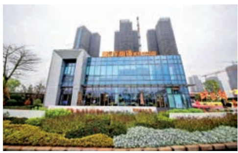
▲時代愛車小鎮集合居住、商業、辦公、科技於一體，既可工作又可生活。

佛山是廣東省內三大整車生產基地之一，汽車工業總產值穩居全省第二位，2020年，投資百億的南海桂城時代愛車小