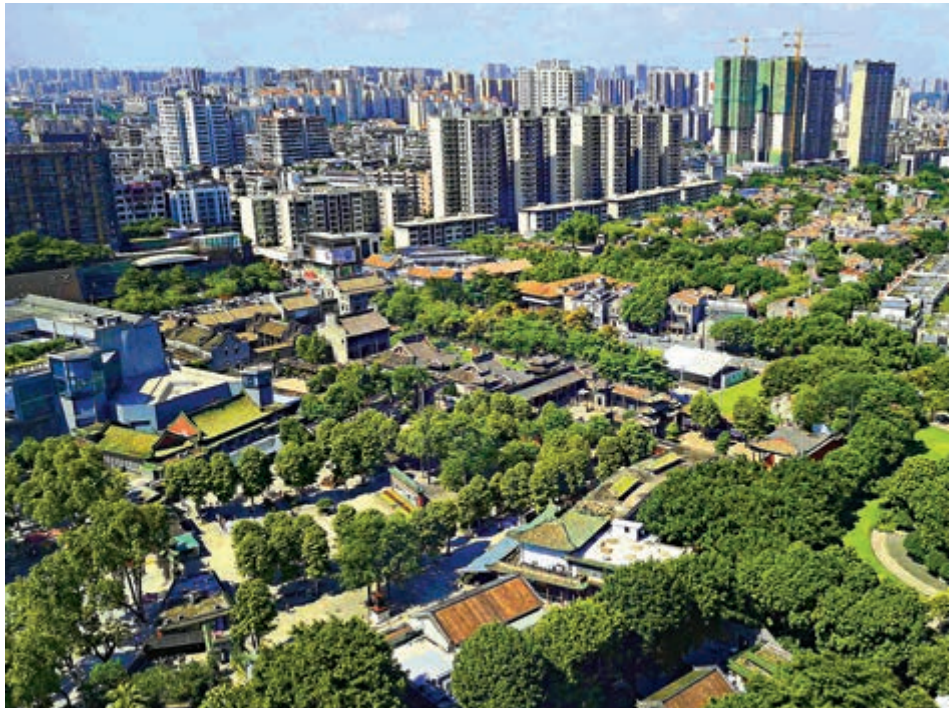
▲禪城嶺南天地商圈由港資打造，成為當地的著名地標。

地方，現有廣佛線的祖廟站、普君北路站、朝安站、同濟路站經過。祖廟道路交通四通八達，轄區內季華路東西出口分別與佛山一環連接；祖廟與佛山市其他四區均處於半小時交通圈範圍內。