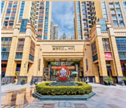
▲普君新城華府小區大門入口。