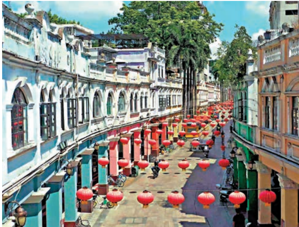
▲大良是順德的政治、文化中心，亦是順德區樓價最貴的板塊。