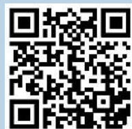
學生為醫護打氣短片