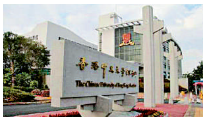
▲ 2014年，香港中文大學（深圳）開校。

● 港深簽署《關於港深推進落馬洲河套地區共同發展的合作備忘錄》。 ● 特區政府成立20億港元創科創投基金。