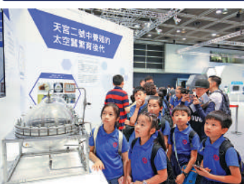
◀ 「創科博覽2017」以我國古代科技文明與今日的創科成就為博覽會主題。

● 國務院正式發布《粵港澳大灣區發展規劃綱要》。 ● 創科署與科技部推出「內地與香港聯合資助計劃」。