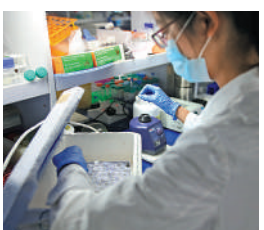
◀ 科技是第一生產力，未來的競爭將是創新科技的競爭。