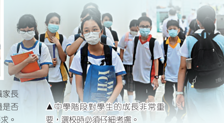
▲中學階段對學生的成長非常重要，選校時必須仔細考慮。