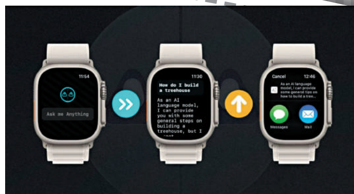
◀Apple Watch用戶可以使用到ChatGPT聊天機器人功能。