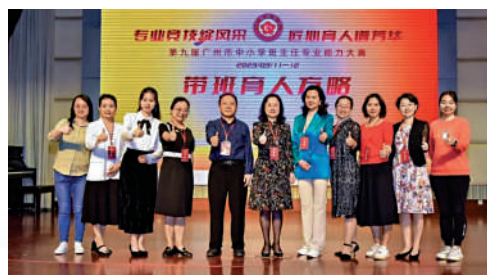
▲第九屆廣州市中小學班主任專業能力大賽在廣州市第一中學舉行。

近年來，廣州市教育局非常重視班主任隊伍建設，建立了新的培養體系，探索班主任隊伍建設的有效路徑，促進廣州市中小學班主任工作的專業化發展，為高品質發展的廣州教育提供堅實保障。