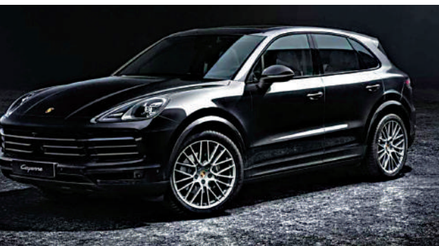
▲保時捷的Cayenne將會推出電動版。