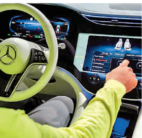
▲平治與微軟達成協議，將在美國的平治汽車加入ChatGPT，能夠進行極其逼真的人類對話。