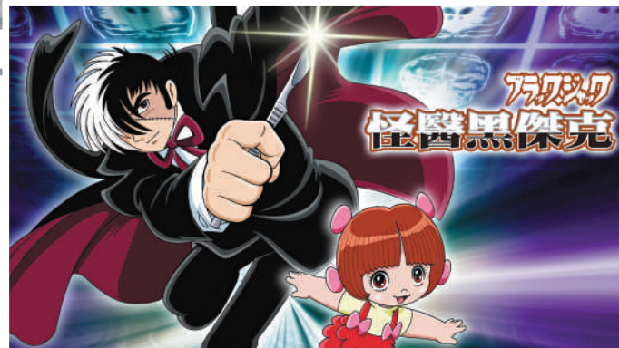
▲AI創作的《怪醫黑傑克》全新故事，將於今年秋季開始連載。