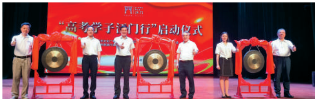
▲「高考學子江門行」啟動儀式在江門市文化館舉辦。

路（兩天遊）共3條線路產品，讓高考學子們在旅程中體驗江門秀美風光的魅力，了解江門厚重多彩的文化。