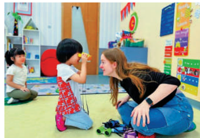
▲位於蛇口的一間國際學校，在課後增益課引入西語、法語、韓語等。

結合孩子成長的特點和規律，開設了涵蓋體育、藝術、語言等多個領域的課後增益課程，實現了全面教育和個性化輔導。其中，多語言作為未來邁向世界的階梯，其語言課後增益課包含了西語、法語、韓語等語種，為孩子成長打下了堅實的基礎。