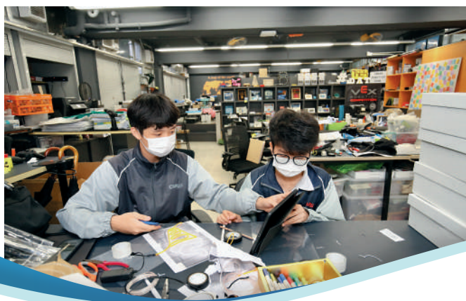
◀學生熱愛科研，花盡腦汁製作小發明。