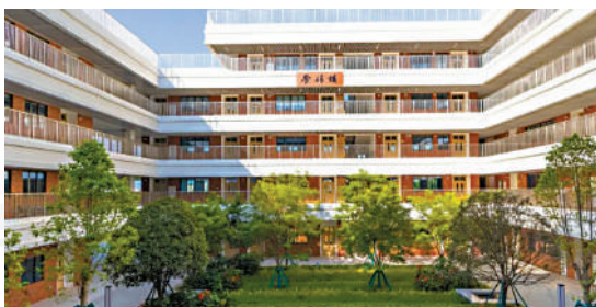
▲鎮遠中學將於明年9月開學，收近千名新生。

而位於交椅灣的濱海灣外國語學校建設現場也一片火熱。連月來，600多名建設者快馬加鞭，推進教學樓、宿舍加速「生長」，目前已完